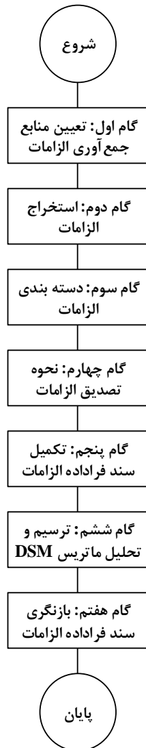
شکل ۲- فرآیند انجام پژوه