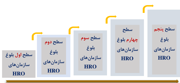
شکل ۱- سطوح ۵ گانه مدل بلوغ سازمان‌های با قابلیت اطمینان بالا

در ادامه به شرح یافته‌های تحقیق، اجزاء و مشخصات مدل بلوغ طراحی شده و تشریح ویژگی‌های هریک از سطوح بلوغ می‌پردازیم. این مشخصه‌ها با بهره‌گیری از روش فراترکیب و از بررسی مدل‌های مورد مطالعه دریافت شده است و ترکیب، تجمیع و یکپارچه سازی شده است.