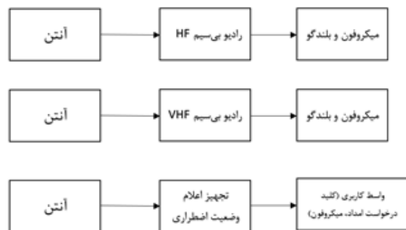
شکل ۳. اجزا و ارتباطات داخلی سامانه ارتباطات بی‌سیم شناورها در آب‌های ساحلی

رادیو بی‌سیم فرکانس VHF برقراری ارتباط بی‌سیم شناور با ساحل و یا سایر شناورهای اطراف در محدوده LOS شناور را فراهم می‌نماید، رادیو بی‌سیم فرکانس HF برقراری ارتباط بی‌سیم شناور با ساحل و یا سایر شناورهای اطراف در محدوده NLOS شناور را فراهم می‌نماید و تجهیز ارتباط ماهواره‌ای امکان ارتباط ماهواره‌ای را فراهم می‌کند، در مجموع در محدوده فرکانسی HF یا VHF و یا ارتباط ماهواره‌ای، GMDSS می‌تواند درخواست کمک و امداد دریایی بصورت پیام‌های از پیش تعیین شده ارسال نماید و یا پیام‌های درخواست کمک و امداد سایر شناورها را دریافت نماید.