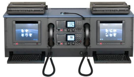
شکل ۲. سامانه بین‌المللی ایمنی و نجات دریایی GMDSS